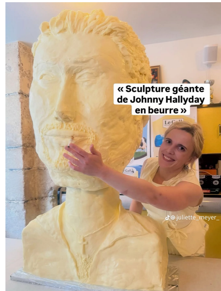
« Sculpture géante de Johnny Hallyday en beurre »

Leur matière première d'exception ? Pas moins de 50 kilos de notre beurre, choisi pour son gage de sérieux et nos médailles au Concours Général agricole !